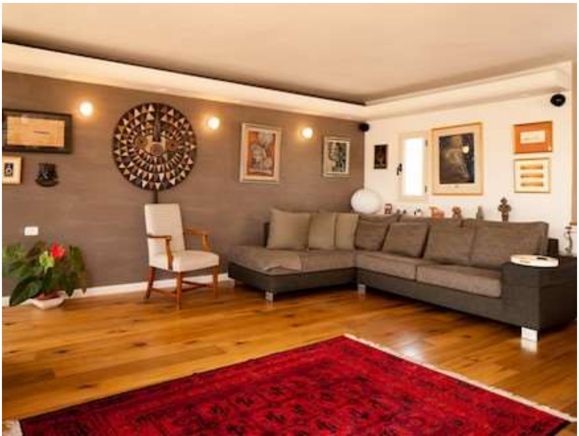
הסלון מהווה רקע הולם לחפצי האומנות הרבים