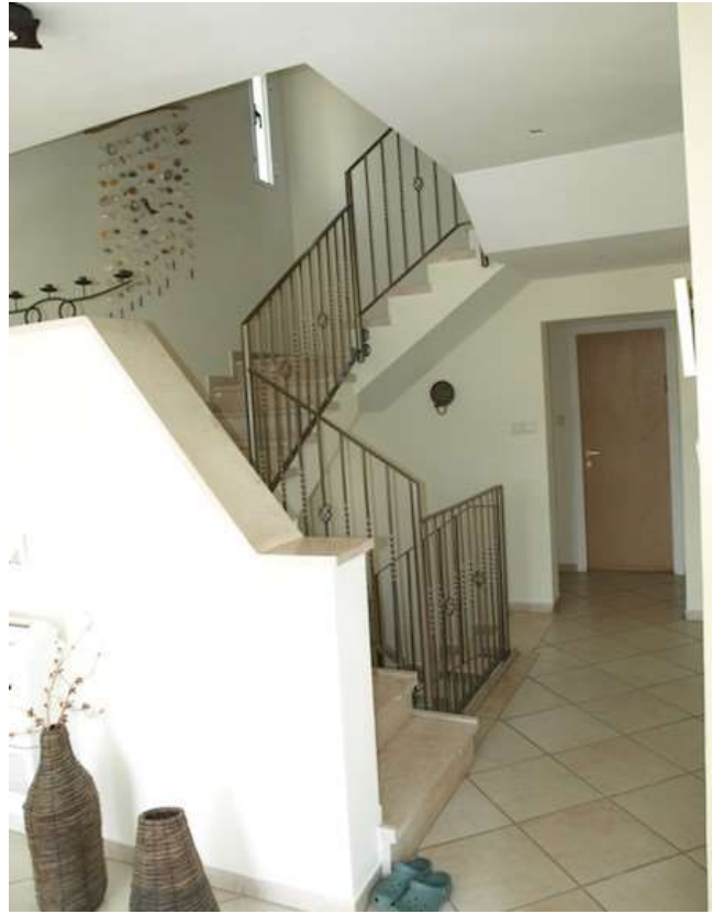
כך נראו המדרגות בגרסה הקודמת

משך השיפוץ: תהליך התכנון לקח כשלושה חודשים והשיפוץ עוד כשלושה חודשים.