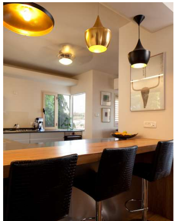
גופי תאורה מרהיבים מעל הדלפק במטבח