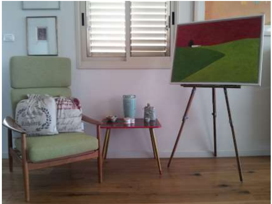
ויש גם פינת ציור מלאת השראה