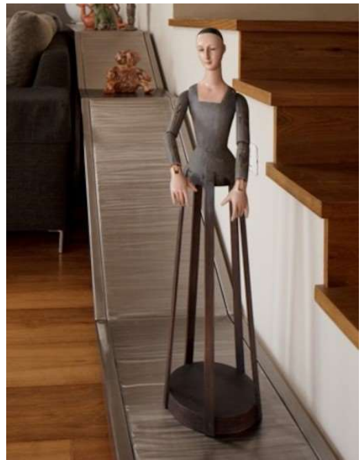
על קונזולת הנירוסטה מוצבים פסלים מרחבי העולם