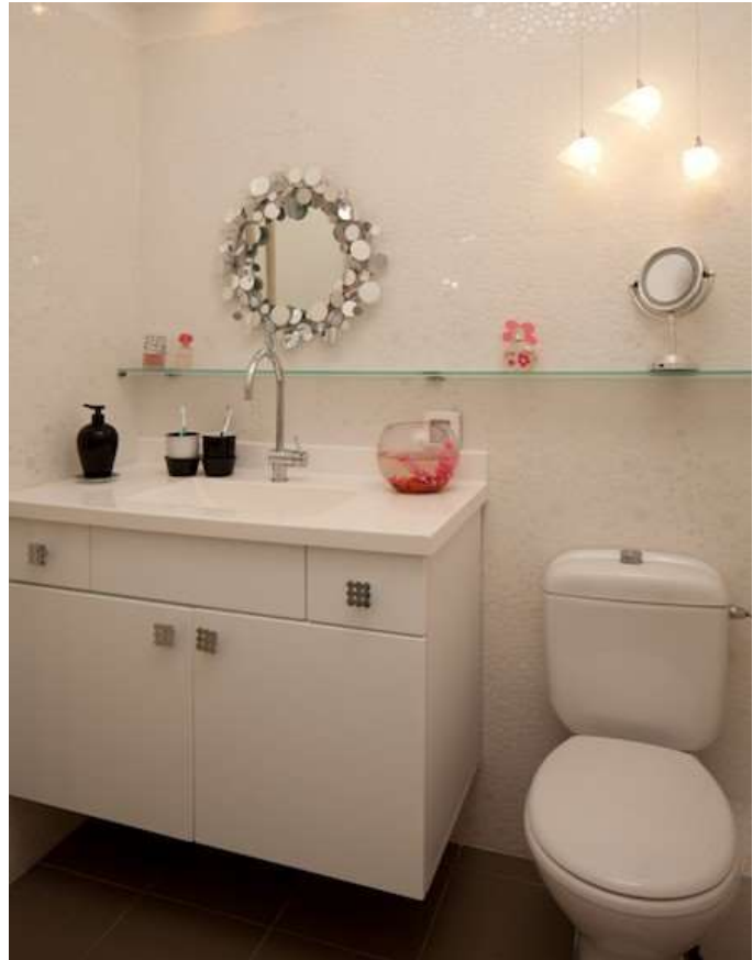
בחדר הרחצה של הילדים שולט מראה העיגולים

שירותי האורחים הקטנים לא חופו באריחים, אלא נצבעו באותו גוון מוקה, בו צבוע שאר החלל, על מנת לתת תחושת מרחב. כך גם ריצוף הפרקט שממשיך לתוך החדר. הכיור עשוי נירוסטה משולבת עץ אלון התואמת לפרקט. מסיכות שונות מעטרות את החלל ביניהן מסיכות מקמרון האפריקאית ומסיכה של "רופא הדבר" מוונציה. המנורה העשויה רשת מתכתית נקנתה אצל מעצבת תאורה מפלורנטין לפני שני עשורים.