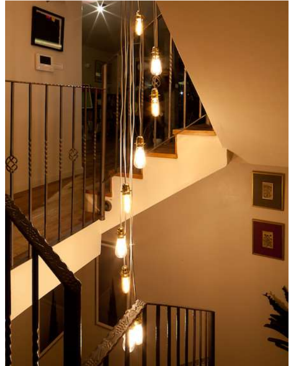
גוף תאורה בעיצוב אישי יורד לאורך שלוש הקומות

החלום היה דירה מוארת, מאווררת עם נוף פתוח. היה אילוץ תקציבי גדול, אך לא התפשרנו על הפרקט התלת שכבתי שממנו עשויות גם המדרגות ולעומת זאת, המטבח עשוי פורמייקה דמוית אלומיניום, שהיה יקר מדי כחיפוי מטבח.